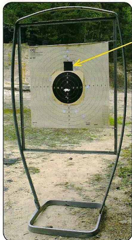
La contre-visée nécessaire pour le tir en calibre .38 Special est beaucoup moins importante, les projectiles frappant la cible 12 cm plus bas.

armes à feu, d'équiper le stand improvisé en conséquence, en installant des parois pare-balles en tôle ou en bois épais précédées, par exemple, de tentures afin d'éviter les rebonds.