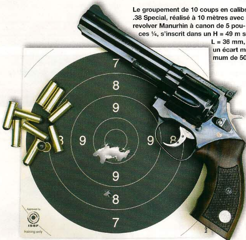
Le groupement de 10 coups en calibre .38 Special, réalisé à 10 mètres avec un revolver Manurhin à canon de 5 pouces ¼, s'inscrit dans un H = 49 m sur L = 36 mm, avec un écart maximum de 50 mm.