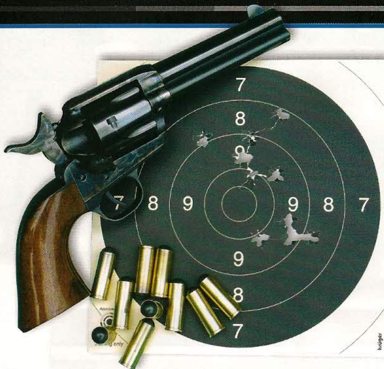
Le groupement de 10 coups en calibre .45 Long Colt, réalisé à 10 mètres avec une réplique Uberti de Colt Peacemaker à canon de 4 pouces ¾, s'inscrit dans un H = 90 m sur L = 79 mm, avec un écart maximum de 105 mm.