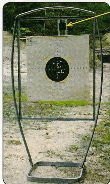
Le tir en calibre .45 Long Colt nécessite une importante contre-visée, les balles frappant la cible 30 cm plus bas.