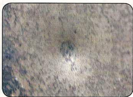
Une plaque en tôle ordinaire de 2 mm d'épaisseur suffit à stopper les projectiles, mais on note quand même un enfoncement bien marqué et il convient de faire attention aux rebonds.

Par sa précision et sa faible dangerosité, ce nouveau type de munition est très intéressant, parce qu'il permet d'effectuer des démonstrations ou des séances d'initiation dans les lieux les plus divers. Le prix de revient est faible, d'autant plus que les projectiles peuvent très souvent être récupérés et réutilisés. Pas besoin de casque anti-bruit, ni d'aménagements onéreux. Il ne faut toutefois pas considérer ces projectiles comme inoffensifs et il est indispensable, outre de respecter toutes les mesures de sécurité habituellement d'usage avec les